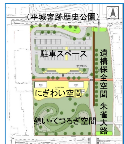
(平城宮跡南側計画イメージ)