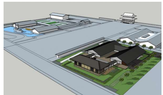
(歴史体験学習館のイメージ)