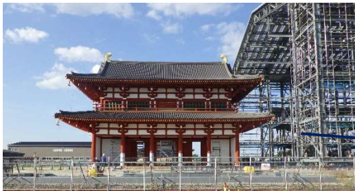
南門 令和3年度完成予定